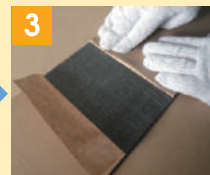
3 剥離紙の折り曲げ (左右に15cm程度)