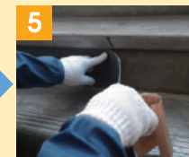
5 下地への全面固定