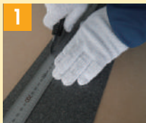
1 蹴込みサイズにシートを裁断