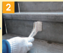
2 蹴込み部前面に 専用プライマー塗布