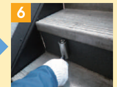
6 下地への全面圧着