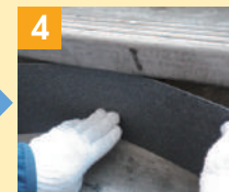
4 下地への中央部固定